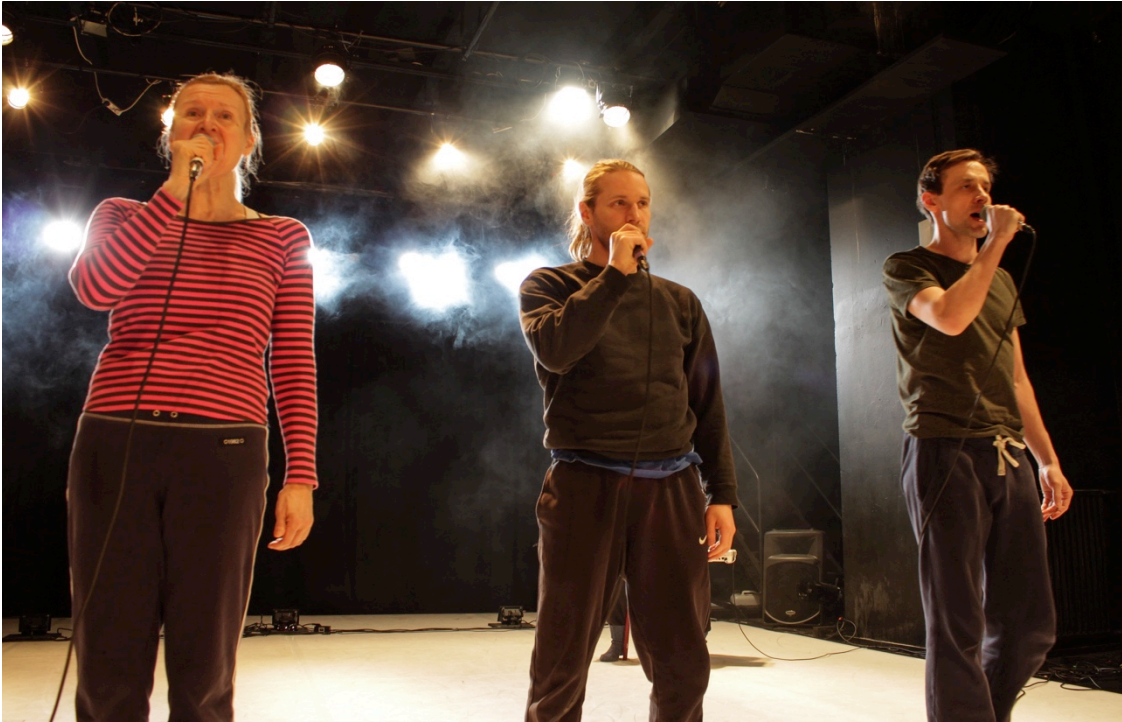
Esityksen harjoitukset Kajaanissa