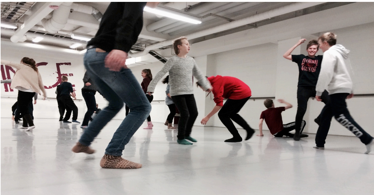
Työpaja Kouvolassa, valokuva Sari Palmgren

Työpajoja oli yhteensä 50 kpl ja niihin osallistui 514 ihmistä.